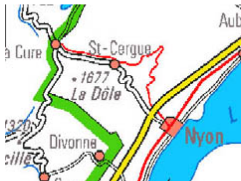
Extrait de carte nationale au 1:1'000'000 (source OFT)