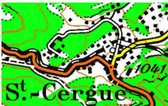
Extrait de la carte nationale au 1:25'000

de végétation, la diversité des unités et leur nombre diminuent avec l'échelle pour conserver une représentation visuellement interprétable. Dans les figures ci-dessous, la commune de Saint Cergue est représentée par les bâtiments qui la constitue au 1:25'000 et devient un symbole ponctuel au 1:1'000'000.