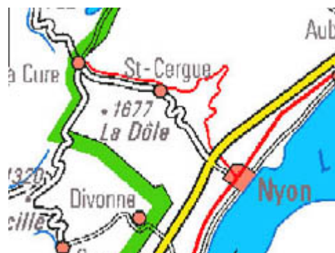
Extrait de carte nationale au 1:1'000'000